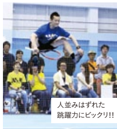
人並みはずれた 跳躍力にビックリ!!