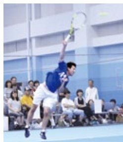
強烈な打球音に 心地よさすら感じます