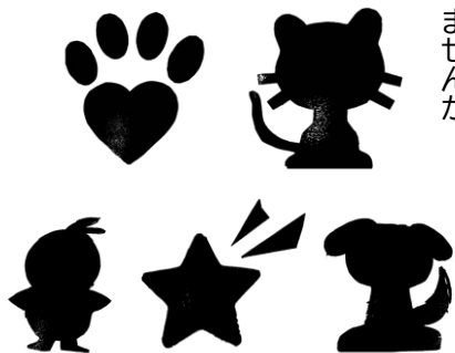
新たに追加される ステンシルマーク

自分自身が楽しむために、自分の好みのカラーでステンシルマークを入れてみませんか。