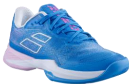
ウィメンズ用 ジェットマッハ3