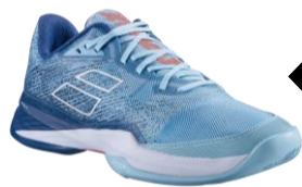
メンズ用 ジェットマッハ3

3月18日(土)には「バボラコートジャック」を行います。その際には、サイズサンプルがありますので是非お試しください！